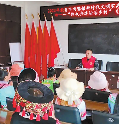
靶向施策精准普法

普法强基补短板专项行动启动以来,蒙自市鸣鹭镇围绕向谁普、谁来普、普什么、怎么普的主线,聚焦重点区域和重点对象精准发力,着力夯实基层普法基础,增强全民法治意识,打通群众办事依法、遇事找法、解决问题用法、化解矛盾靠法的梗阻环节。目前,辖区内刑事发案率同比下降47.37%、信访总量同比下降63.64%、矛盾纠纷同比下降40.7%,无命案、无未成年人犯罪和侵害未成年人犯罪案件发生。