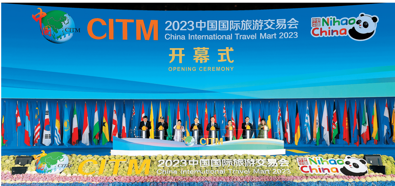
11月17日,2023中国国际旅游交易会在昆明开幕。

王宁对莅临大会的海内外嘉宾表示热烈欢迎。他说,近年来,云南大力推进旅游业转型升级,旅游总收入实现从千亿级到万亿级的跨越。今年以来,我们推出“有一种叫云南的生活”,引领了旅游新时尚。这是一种生态绿色的生活、一种多姿多彩的生活、一种和谐幸福的生活、一种开放包容的生活,归根到底是人民群众的生活。在中国式现代化建设新征程上,云南将深入学习贯彻习近平文化思想,加快文化和旅游强省建设,让更多群众在家门口吃上“旅游饭”,使发展旅游的过程,成为增进各民族相知相亲相