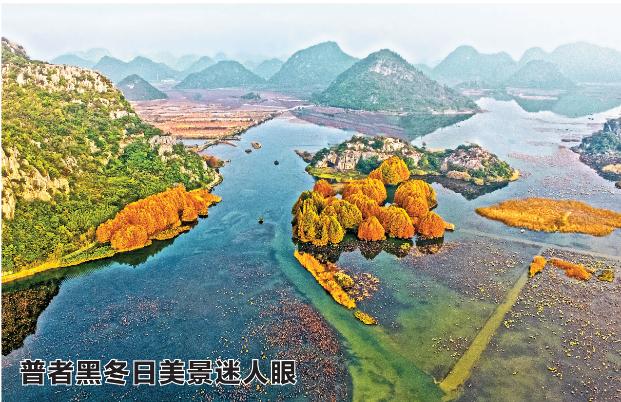
普者黑冬日美景迷人眼

冬日,丘北普者黑风景区美如仙境。置身这座5A级旅游景区内,目之所及,湖泊峰林、层林尽染,水上田园、候鸟翩跹,令人心旷神怡,流连忘返。