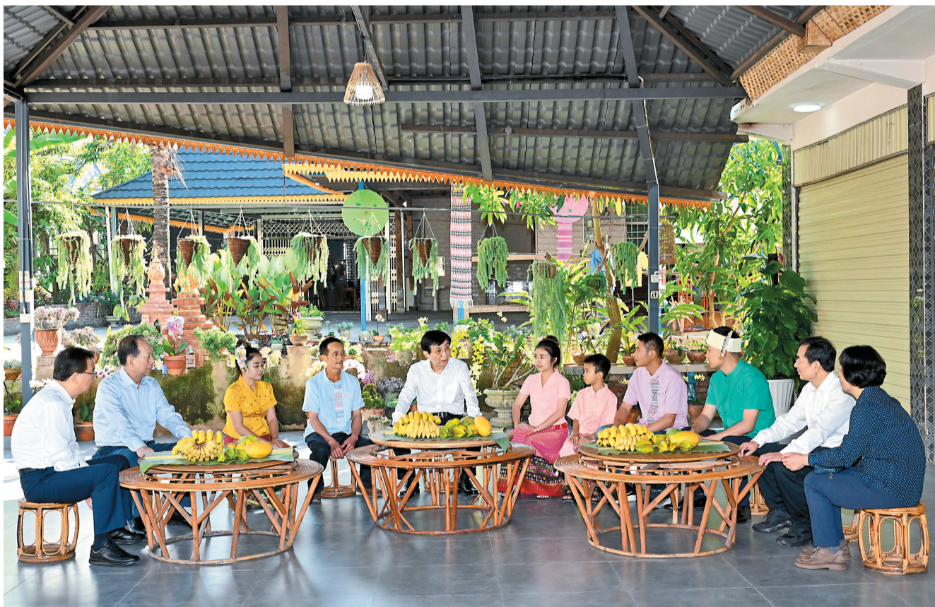
12月17日至19日,中共中央政治局常委、全国政协主席王沪宁在云南西双版纳、玉溪、昆明调研。这是12月17日,王沪宁在西双版纳傣族自治州景洪市曼景罕居民小组看望傣族群众,并同当地干部群众交流。

调研期间,王沪宁表示,云南认真落实党中央关于民族宗教工作的决策部署,民族宗教领域总体和谐稳定。要把铸牢中华民族共同体意识作为新时代党的民族工作和民族地区各项工作的主线,