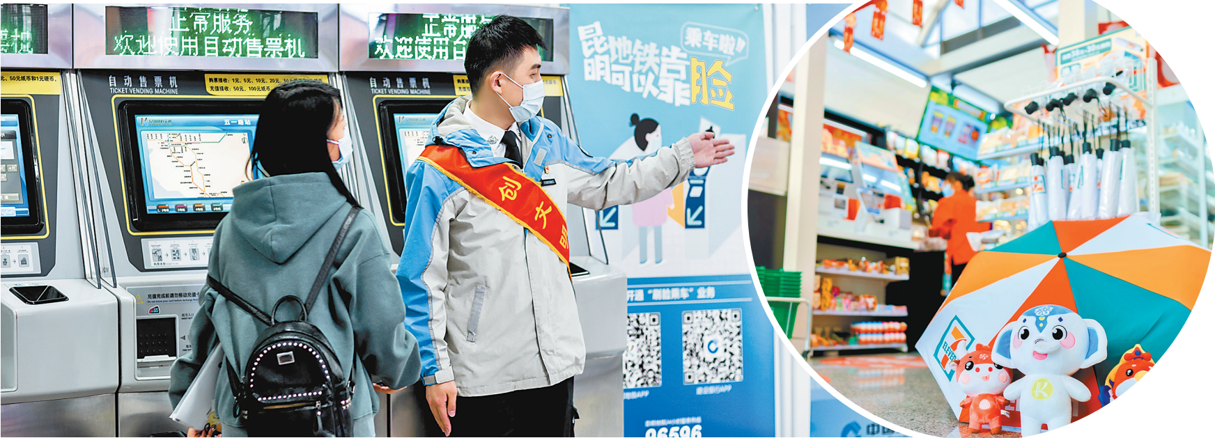
昆明地铁运营服务