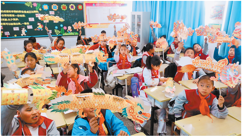
近日,西山区观音山中心学校以龙年为主题,为开学返校的同学们精心准备传统文化特色活动,培养孩子们对传统文化热爱,开启新学期。

业一创新型领军企业梯队。2023年,全区共培育认定云南省科技型中小企业89家、国家科技型中小企业161家,成功获批创新型中小企业59家,专精特新中小企业29家,评审认定高新技术企业112家。同时,提升研发强度,实行“一企一策”帮助企业提升研发创新能力,2023年,全区社会研发投入强度达2.78%。 2024年,盘龙区将抢抓新一轮科技革命、产业转移、沿边开放等发展机遇,持续增强高质量发展新动能。着力强化数字赋能,推进云南省大数据产业集聚示范区建设;以沪滇产业合作为契机,整合辖区土地、老旧厂区 and 产业链等资源,加强要素保障,探索建立承接产业转移新机制,加快中国医药工业研究总院等合作项目落地,争取更多优质企业落地盘龙。