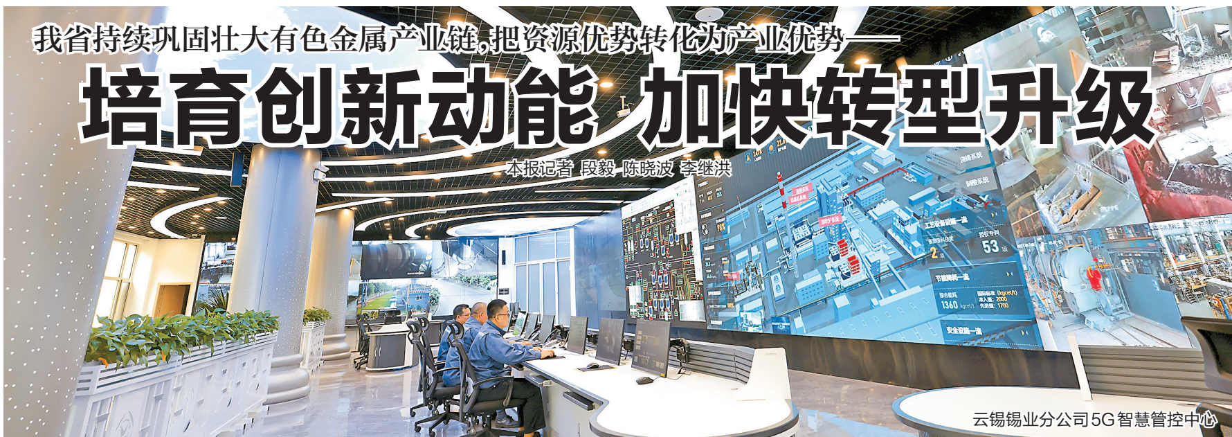
云锡锡业分公司5G智慧管控中心

有色金属产业是云南传统优势产业之一，近年来，我省不断提升产业发展水平和竞争力，持续巩固壮大有色金属产业链，把资源优势转化为产业优势，加快推进有色金属产业转型升级。