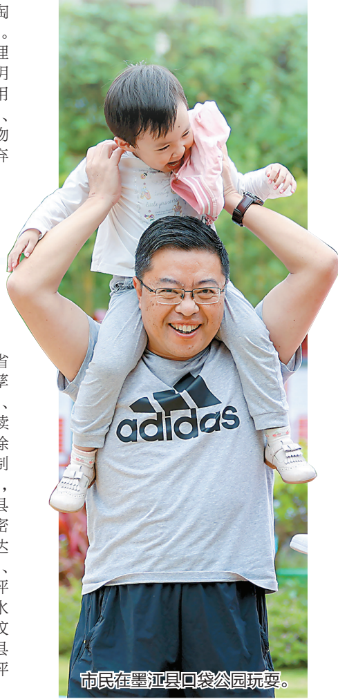
市民在墨江县口袋公园玩耍。

“除四害”专项行动实施以来，全省扎实推进“除四害”专项行动，“四害”孳生环境整治有力、专业队伍有效充实、疫病传播大幅下降、达标县城数量持续增加、防制体系更加健全，各地推进“除四害”专项行动工作机制有创新、防制手段有创新、管理模式有创新。据统计，截至2024年4月，全省共有127个县(市、区)通过鼠类、蚊虫、蝇类和蟑螂密度控制水平省级四项达标考核评估，达标数比2022年底增加了99个县(市、区)。其中，鼠密度控制水平通过省级评估127个县(市、区)；蟑螂密度控制水平通过省级评估129个县(市、区)；蚊密度控制水平通过省级评估127个县(市、区)；蝇密度控制水平通过省级评估127个县(市、区)。