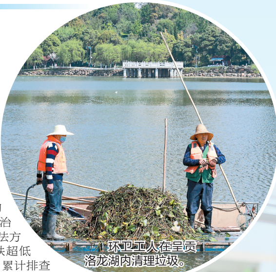
环卫工人正在贡洛龙湖内清理垃圾。

碧水映蓝天，白云抚青山。爱国卫生新“7个专项行动”开展以来，我省在大气污染防治、饮用水水源地保护、医疗废物处理处置、噪声污染治理等方面不断创新执法方式。2023年，推进钢铁超低排放改造项目171项，累计排查挥发性有机物排放重点企业3139家。累计完成烤烟房煤改电8831座，淘汰国三及以下排放标准汽车83673辆。开展建筑施工和城市道路扬尘污染治理“百日行动”，扬尘污染问题举报数量明显下降。全省州(市)级、县级集中式饮用水水源地水质达标率分别为97.7%、98.0%。县级以上城市建成区医疗废物无害化处置率为100%，未发生医疗废弃物处置过程次生生态环境污染事件。