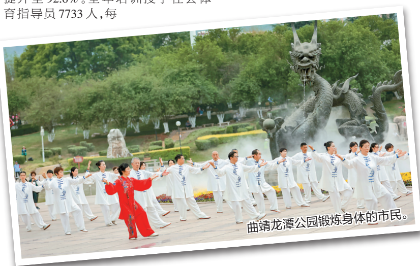
曲靖龙潭公园锻炼身体的市民。

千人公益社会体育指导员人数提升至2.92人。持续打造七彩云南格兰芬多自行车节、奔跑彩云南九大高原湖泊领跑赛等特色品牌赛事活动。广泛开展职工运动会、民族运动会、老年健身运动会等适合各类人群、地域和行业的赛事活动，经常参加体育锻炼人数比例预计提升至42.2%。健身活动日常开展，全年不断线，“三大球”“三小球”“工间操”等社区运动会比赛项目成为大众参与健身活动新载体。