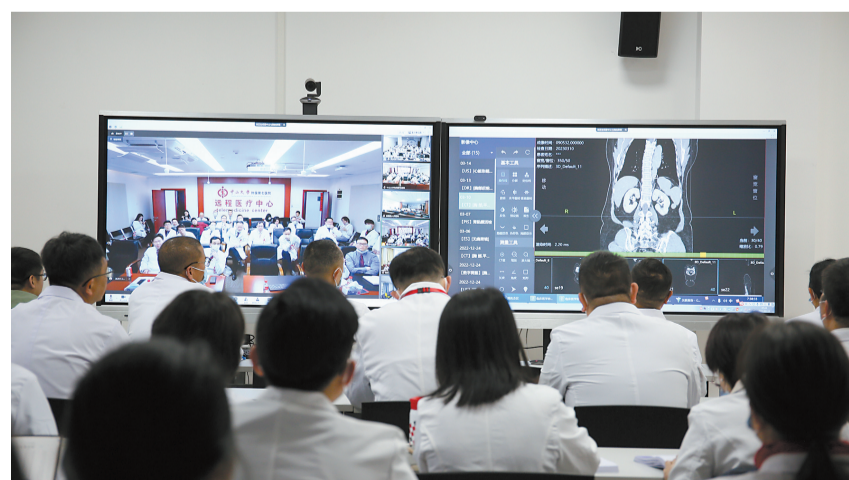
凤庆县紧密型医共体总医院远程会诊。

2020年，凤庆县人民医院互联网医院获批运营，同步推出“医小凤”App，平台设计了“患者端”“村医端”“乡医端”和“县医端”，实现医共体总院与各分院之间、患者与各院之间的有效衔接，让区域县乡村医疗数据共享，医生依靠信息准确诊断。