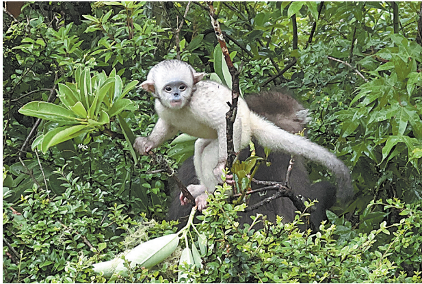
迪庆维西塔城金丝猴保护区。