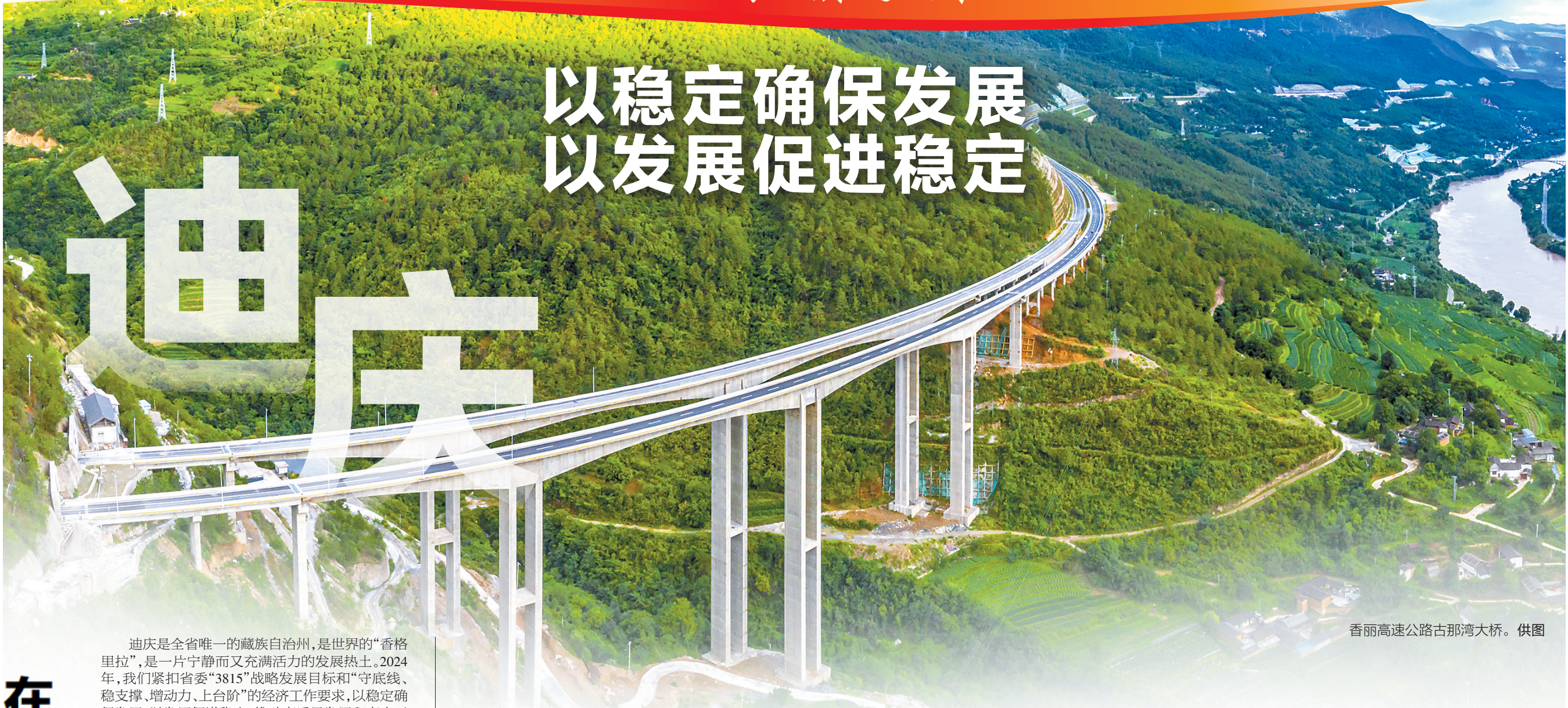
香丽高速公路古那湾大桥。