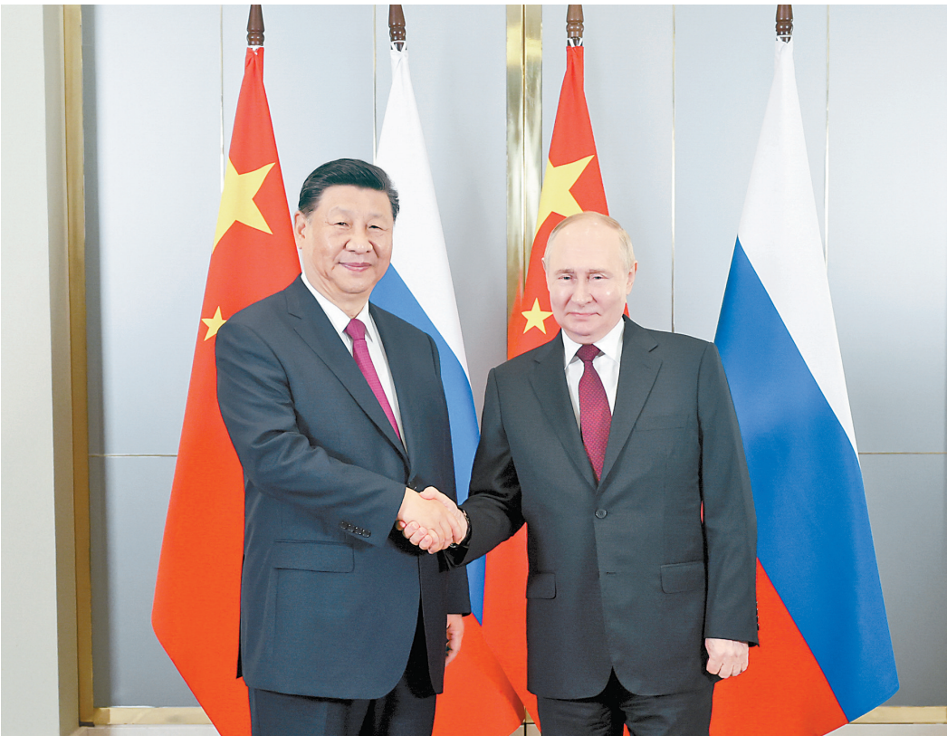
当地时间7月3日晚，国家主席习近平在阿斯塔纳出席上海合作组织峰会前会见俄罗斯总统普京。

新华社阿斯塔纳7月3日电(记者 韩墨 黄河)当地时间7月3日晚，国家主席习近平在阿斯塔纳出席上海合作组织峰会前会见俄罗斯总统普京。 习近平指出，今年5月，普京总统成功对中国进行国事访问，在中俄建交75周年的重要历史节点，我们共同为两国关系下一步发展作出规划和部署。面对变乱交织的国际形势，双方要继续秉持世代友好的初心，坚守造福人民的恒心，不断涵养中俄关系的独特价值，挖掘两国合作的内生动力，为维护两国正当权益和国际关系基本准则作出新的努力。 习近平强调，中俄要继续加强发展战略对接和国际战略合作。中方支