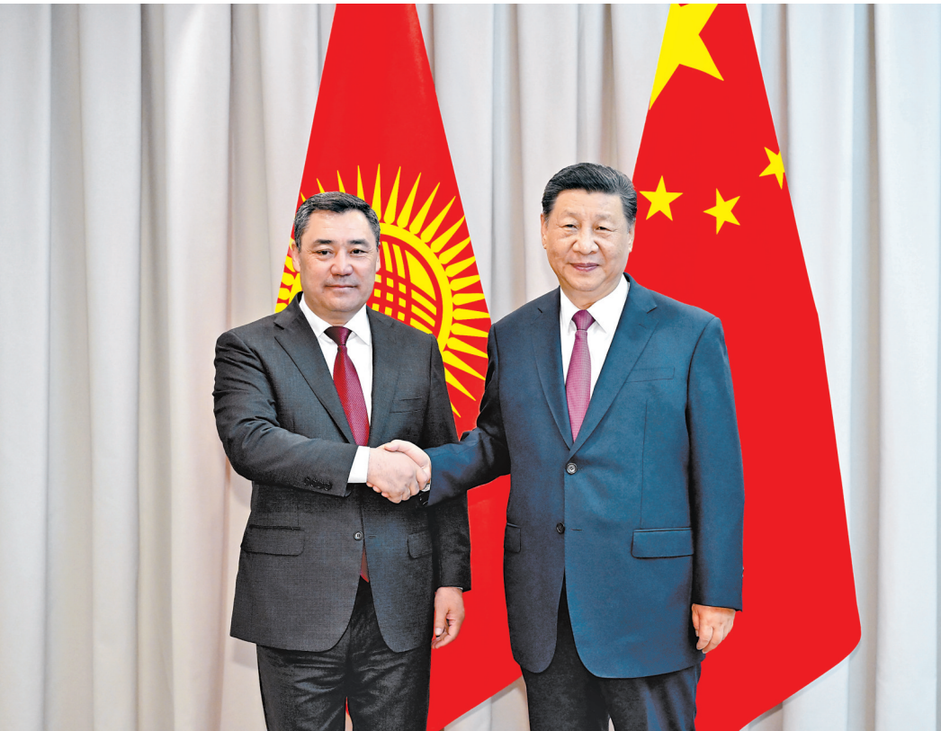
当地时间7月3日下午，国家主席习近平在阿斯塔纳出席上海合作组织峰会前会见吉尔吉斯斯坦总统扎帕罗夫。