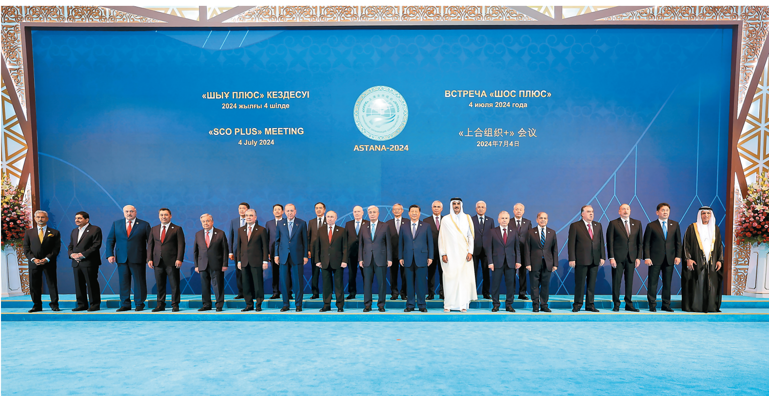
当地时间7月4日下午，国家主席习近平在阿斯塔纳出席“上海合作组织+”阿斯塔纳峰会并发表题为《携手构建更加美好的上海合作组织家园》的重要讲话。峰会开始前，习近平出席托卡耶夫为与会代表团团长举行的欢迎宴会并集体合影。

面对冷战思维的现实威胁，我们要守住安全底线。坚持践行共同、综合、合作、可持续的安全观，以对话和协作应对复杂交织的安全挑战，以共赢思维应对深刻调整的国际格局，共建持久和平、普遍安全的世界。