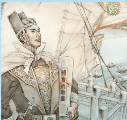
在昆明市钟开天艺术馆展出的长卷草图。 本报记者 郭瑶 摄

《郑和下西洋》是由著名画家钟开天历时13年创作完成的高1.2米、总长500米、重360斤的长卷。全画共3卷18章,展现了与郑和下西洋相关的300余个场景、1.7万余个人物、1000余车船舟楫以及各类飞禽走兽1500余个。画作再现了600多年前郑和船队的航海壮举以及亚非多国人民的生活风貌。