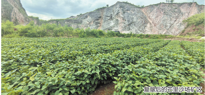
复垦后的芒里沙场矿区

仲夏时分,芒市芒里沙场矿区内,绿油油的大豆从山顶蔓延到山脚,抬眼望去,满目葱绿。