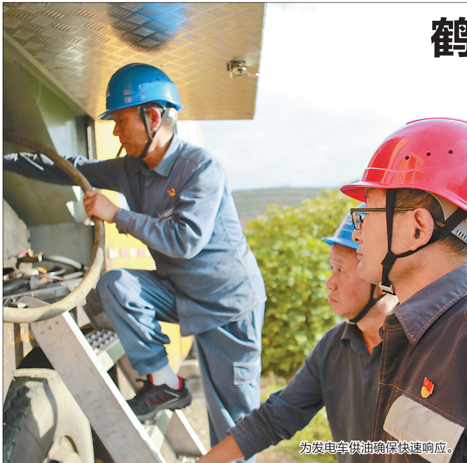
为发电车供油确保快速响应。

所当乘者势也,不可失者时也。深入贯彻落实省委十一届六中全会精神,全省上下当锚定目标、加压奋进,以改革推进派、实干家的精气神,加快培育新动能新优势,在云岭大地上共绘百舸争流、千帆竞渡的时代新图景。