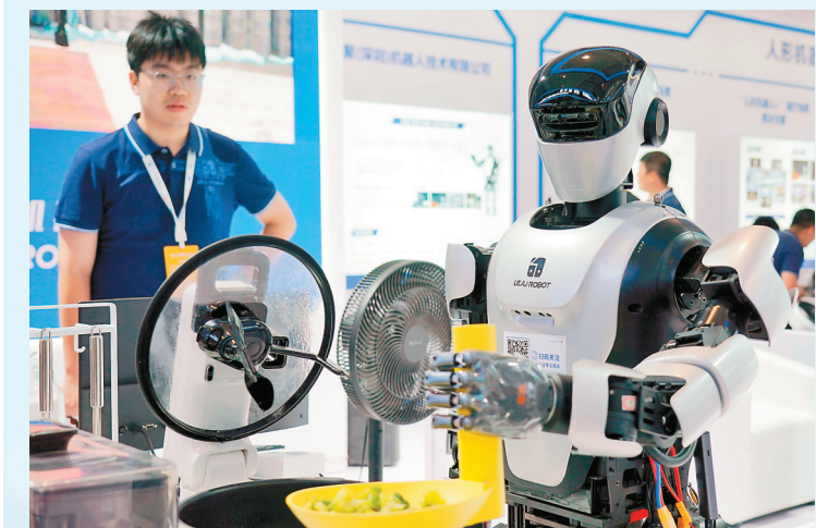
人形机器人在展示炒菜。