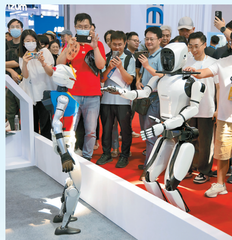
两款人形机器人在互相“问候”。