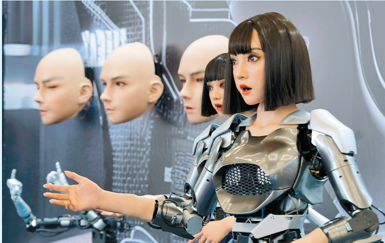
世界机器人大会上展示的人形机器人。