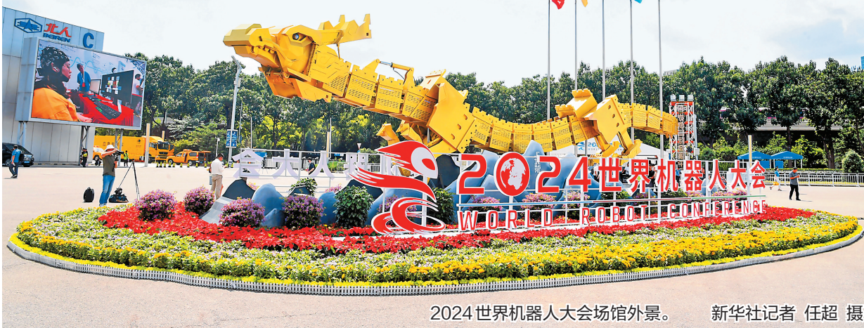
2024世界机器人大大会场馆外景。