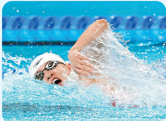
8月31日,在巴黎残奥会女子50米自由泳S11级决赛中,中国选手马佳以28秒96的成绩获得冠军,并打破世界纪录。图为当日,马佳在比赛中。

中国代表团目前以20金15银7铜继续领跑奖牌榜,英国队以11金8银6铜位居次席,巴西队以8金3银12铜排名第三。