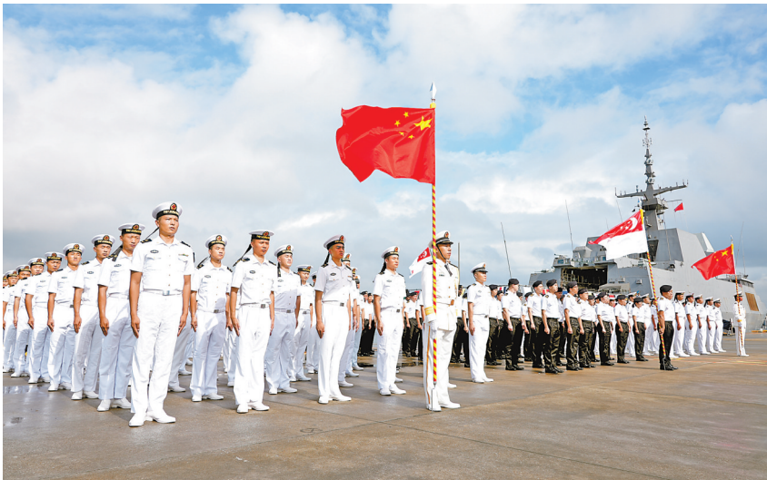
9月1日,“中新合作-2024”海上联合演习开幕式在广东湛江举行。

联合国儿基会还将与泛美卫生组织、全球疫苗免疫联盟、非洲疾控中心、世卫组织等机构合作,推动高收入国家从现有库存中捐赠疫苗。