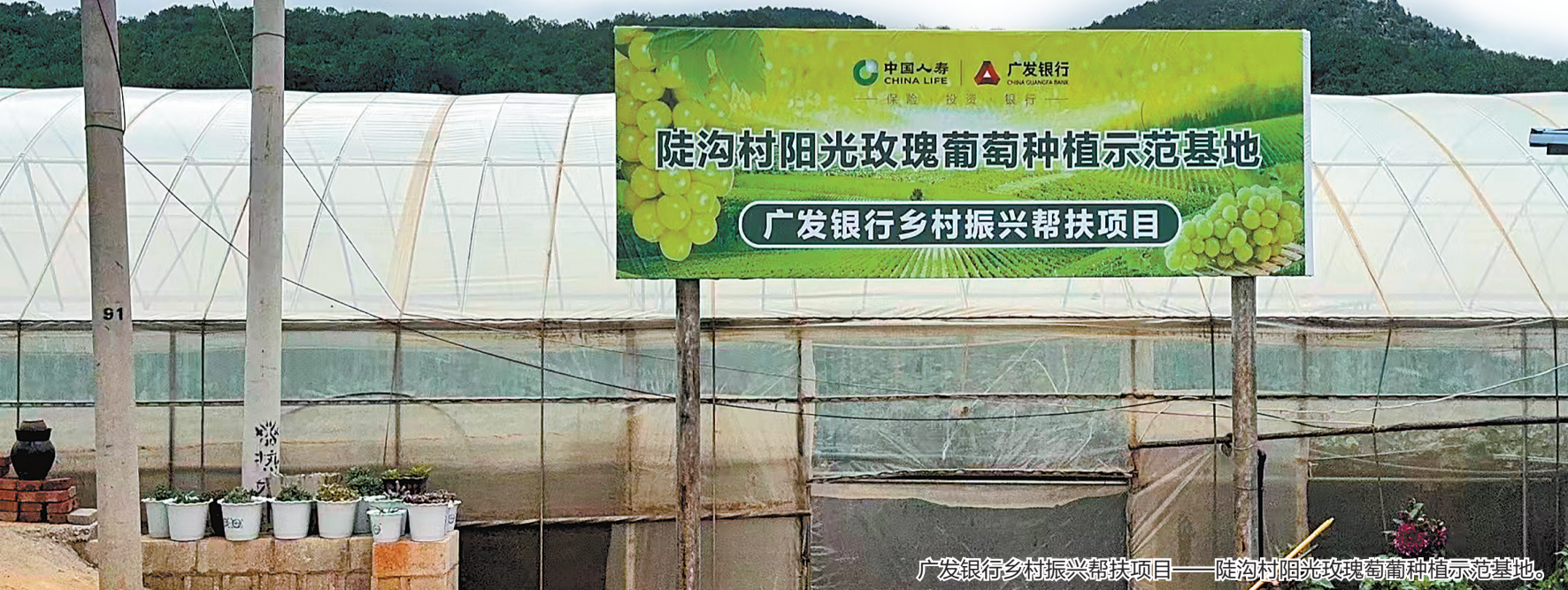
广发银行乡村振兴帮扶项目——陡沟村阳光玫瑰葡萄种植示范基地。

以帮扶点的探索创新为样本，广发银行昆明分行以金融服务创新、模式创新、产品创新，促进信贷资金等金融要素和资源流进广大乡村产业，以金融“活水”精准滴灌助力农户致富，全面“贷”动乡村振兴。