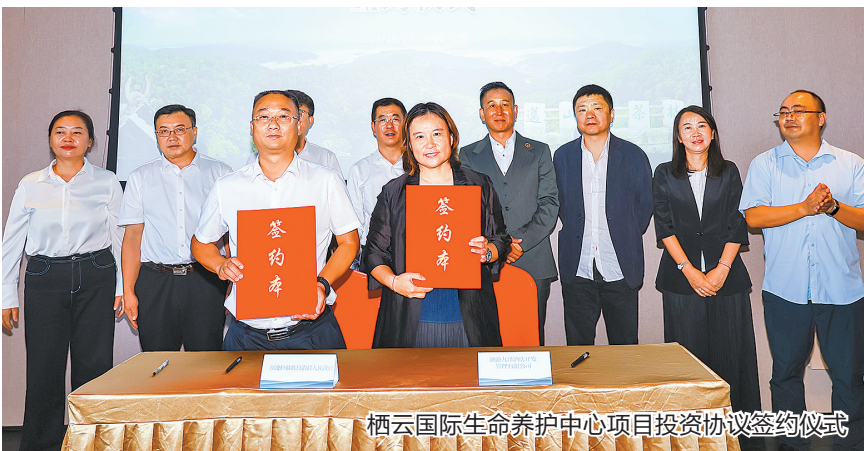
栖云国际生命养护中心项目投资协议签约仪式