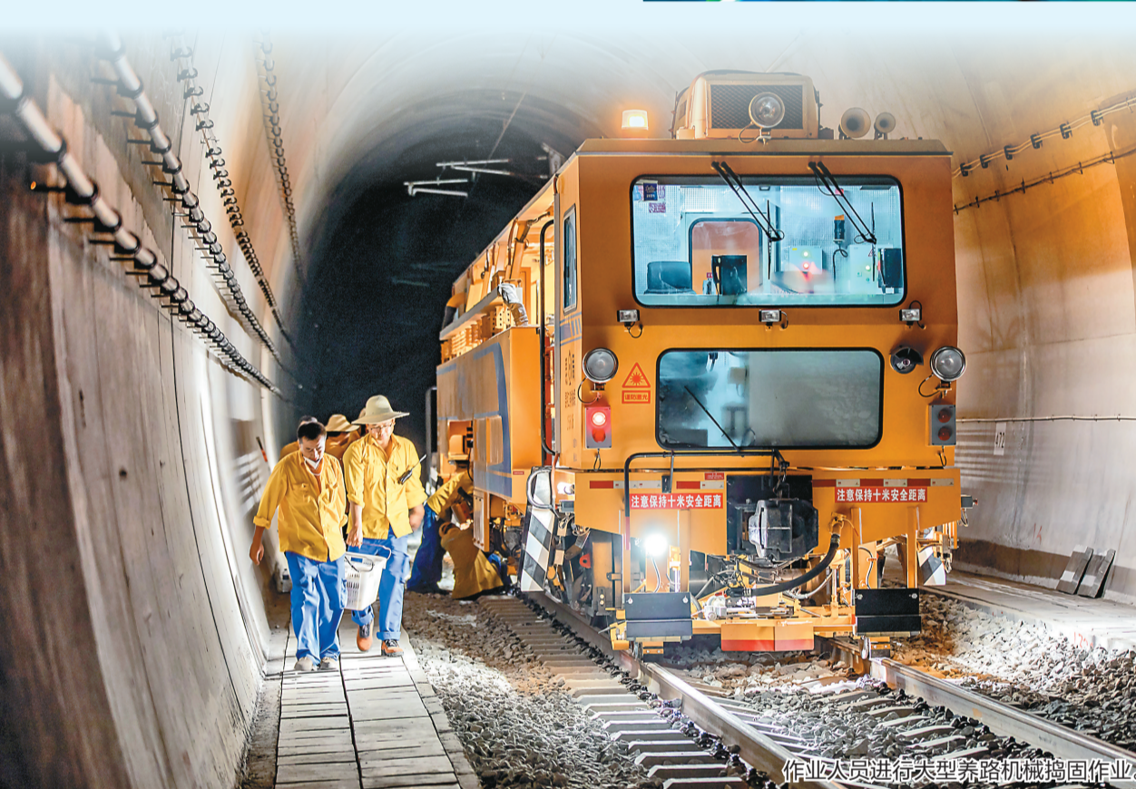
作业人员进行大型养路机械捣固作业。