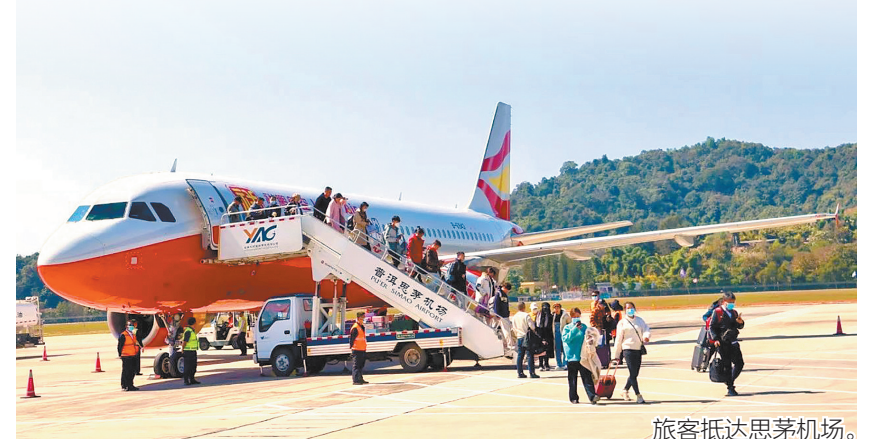
旅客抵达思茅机场。

普洱思茅机场在政府协作、市场客源营销活动、航线精细布局等多方面着力,迎来航空市场复苏新拐点。通过积极沟通协调航空公司洽谈合作,及时调整优化航线结构,将原有单一航线扩展为“多点开花”。与西藏航空、华夏航空、祥鹏航空达成合作,在稳定原有昆明、成都航线的基础上,省内新增丽江、芒市、昭通航线;省外新增泉州、贵阳、西安航线,航班数量由每天1班增加到每天4班,航线增加5条,通航城市达到8个。