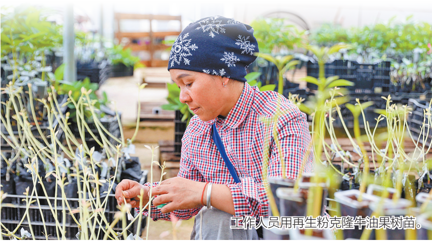
工作人员用再生粉克隆牛油果树苗。