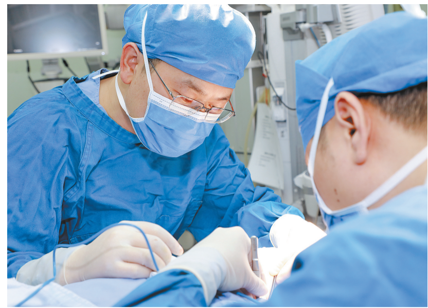
医生正在进行“疏尔术”操作。

本报讯(记者 陈怡希)近日,云南省第一人民医院神经外科团队开展了云南省首例荧光定位引导下颈深淋巴—颈静脉吻合术(“疏尔术”),为一名77岁的阿尔茨海默病(AD)患者实施了外科治疗,为阿尔茨海默病患者开启治疗新希望。