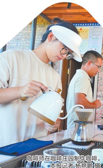
咖啡师在咖啡庄园制作咖啡。