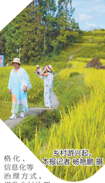
乡村游兴起。