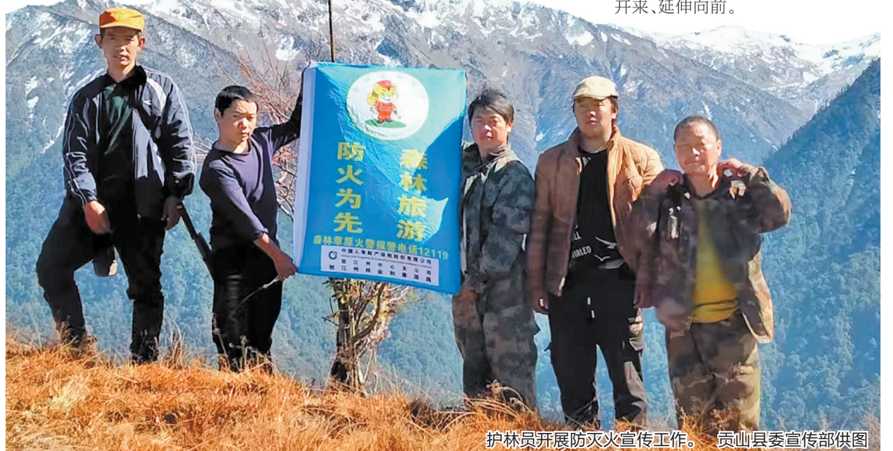
护林员开展防火宣传工作。