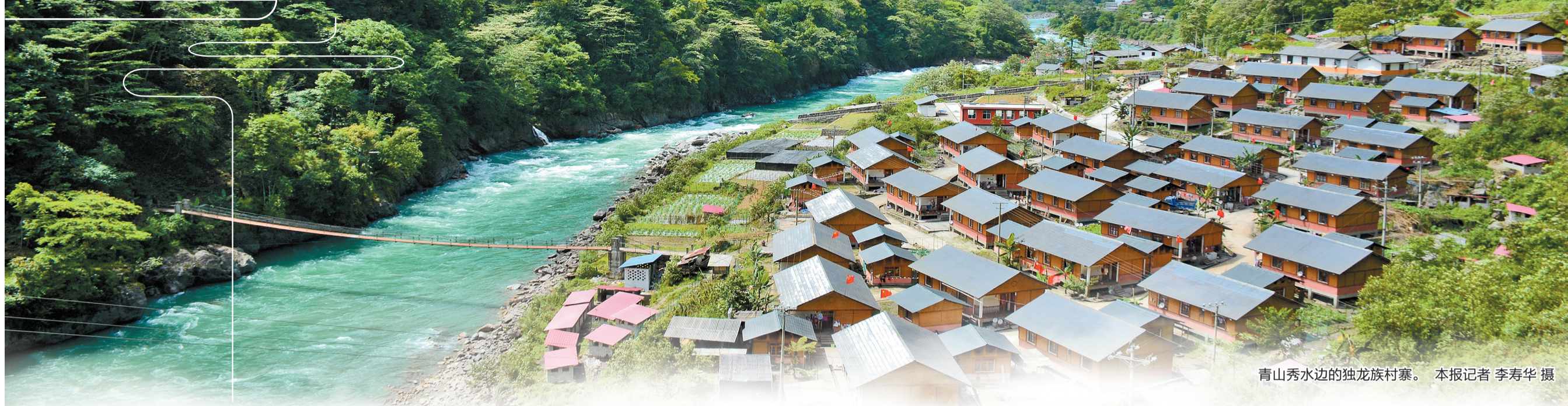
青山秀水边的独龙族村寨。

初冬，行走贡山大地，怒江碧波荡漾，天空白云悠悠，独龙江峡谷绿意盎然。高山村寨树林茂密，山地沟渠草果透绿，农家乐、客栈游客熙攘，呈现出一幅生态好、产业兴、百姓乐的秀美画卷。