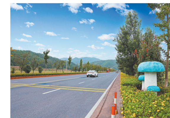
S220线南华网红樱花大道，以6200株冬樱花为基础，砌筑5600米花台，栽种木春菊20万株，形成乔木、灌木错落有致，色彩层次丰富的景观效果。结合南华“世界野生菌王国”的地域特点，设置野生菌造型雕塑10组，吸引大量游客沿途观光。