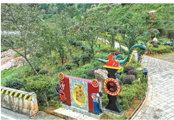
G320线双河桥服务区，以禄丰“世界恐龙之乡”文化为核心，设置禄丰恐龙科普宣传栏，摆放恐龙造型模型10个，打造恐龙文化展示区，寓教于乐。