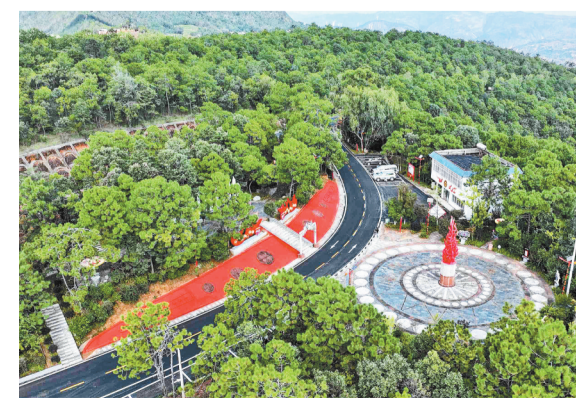
G227线永仁方山川滇交界迎宾广场，突出永仁县彝族文化特色，以彝族传统的红、黑、黄三色和图腾、火焰纹等经典图案为基调，设置了民族团结展示牌，为过往游客提供舒适休息场所，成为展示永仁县民族文化与地域特色、促进川滇文化交流的重要窗口。