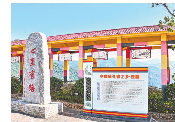
G227线双柏观景台，巧妙融合双柏县“中国绿孔雀之乡”的独特优势，打造精美的绿孔雀雕塑护坡和剪影图案，集中展示绿孔雀文化和生态保护成果，在吸引游客观光的同时，有效提升公众的生态保护意识。