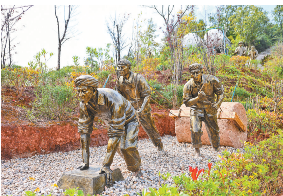
G320线滇缅公路级山坡教育基地与大花桥停车区，聚焦滇缅公路“抗战生命线”和省级文物保护单位大花桥，精心设置观景台、文化走廊和浮雕等，让过往行人在休憩中沉浸式感受滇西抗战的峥嵘岁月，浓厚的文化气息成为服务区的独特标识。

域景观、合理设置安全设施、完善旅游服务设施等举措，打造了集绿化公路、服务旅游、文化传承、产业融合为一体的绿色生态文化公路，建成6个展现“一地一景、文旅交融”的服务区（停车区）。