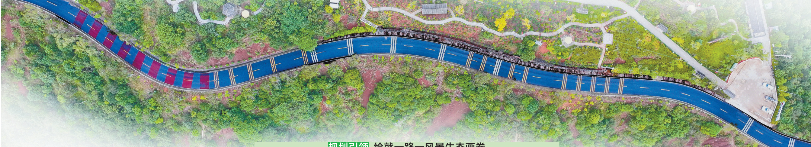
规划引领 绘就一路一风景生态画卷

2027年）”总体要求，创新提出“一廊、三区、多点”的空间布局：“一廊”即构筑贯穿州域南北的国道生态风景长廊，“三区”即打造滇缅公路文化展示区、公路四季景观区、楚雄彝族自治州地域文化体验区，“多点”即布设多个停车区、观景台等服务节点。全力构建“快进慢游”的公路网络新格局，打响绿美公路新三年行动的开局战，让“有一种叫云南的生活”在楚雄可触可感、落地生花。