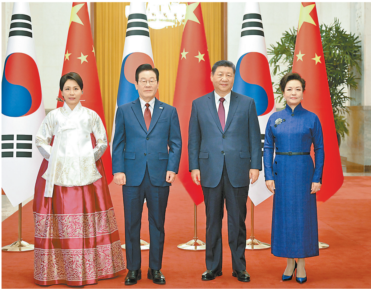
一月五日下午，国家主席习近平在北京人民大会堂同来华进行国事访问的韩国总统李在明举行会谈。这是会谈前习近平和夫人彭丽媛同李在明和夫人金惠景合影。