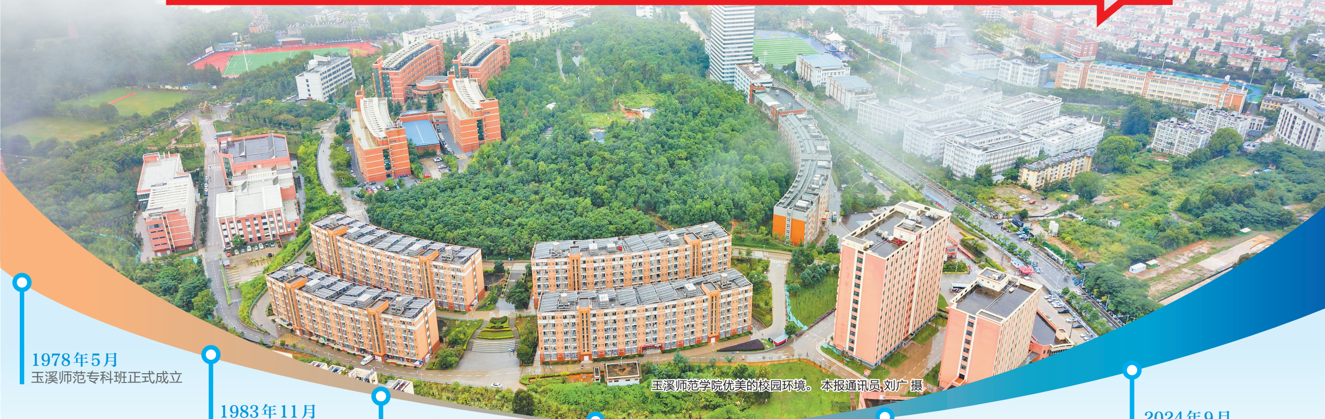
玉溪师范学院优美的校园环境。

色”与“应用亮色”交相辉映，自身发展与服务地方同频共振。这里，既有对教育本真孜孜不倦的坚守，也有面向未来破浪前行的开拓；既涌动着一心为学、静心育人的深沉力量，也迸发着对接产业、赋能发展的蓬勃活力。