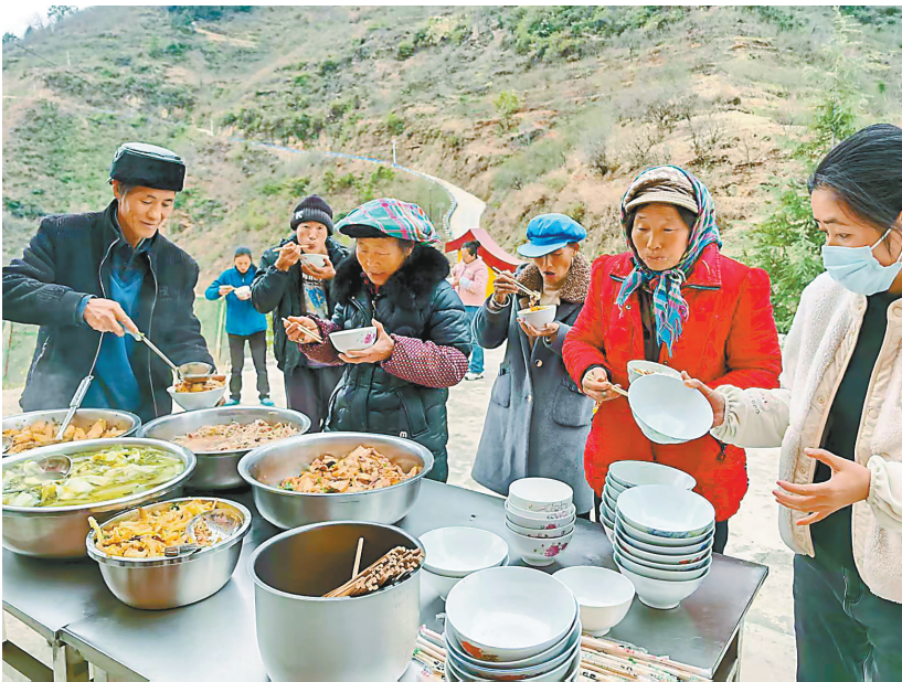
包谷垭乡转移群众在安置点吃饭。