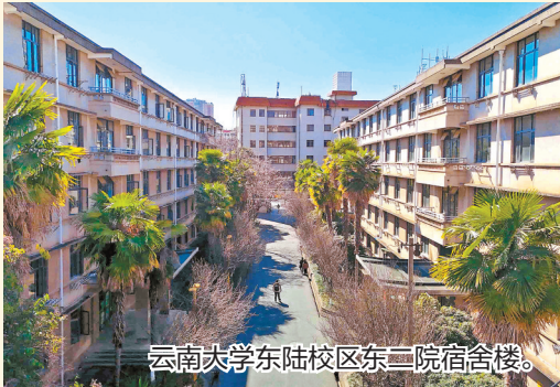
云南大学东陆校区东二院宿舍楼。