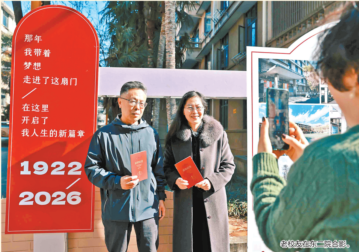
老校友在东二院合影。