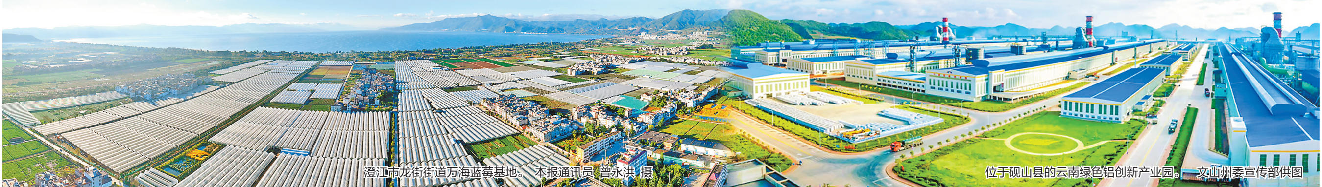
位于砚山县的云南绿色铝创新产业园。