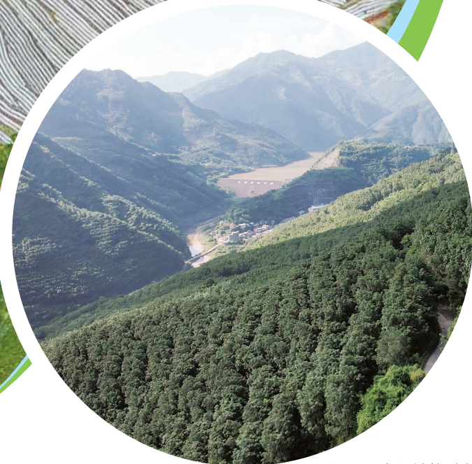
▲墨江县泗南江镇橡胶林。