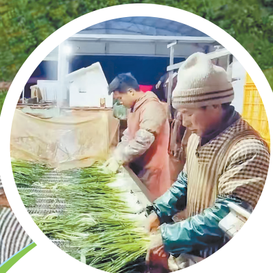
▲泸西县群众在分拣车间清洗小香葱。