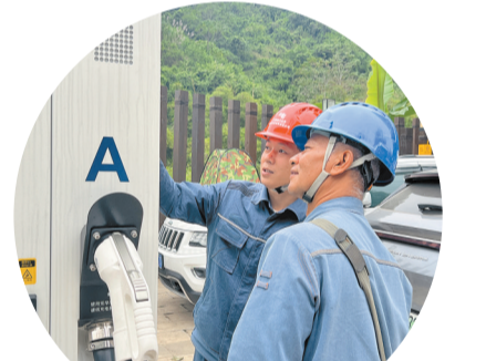
南溪供电所工作人员检查充电桩运行状态。

“我们的陈师傅干设备24小时不停运转,用电很正常,从不需要为此担心。”红河四瑞农业有限公司负责人张权林发自内心的感叹。在该企业的产