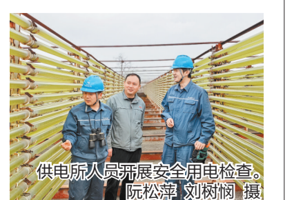
供电所人员开展安全用电检查。