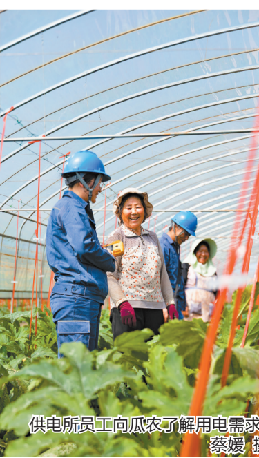
供电所员工向农户了解用电需求。