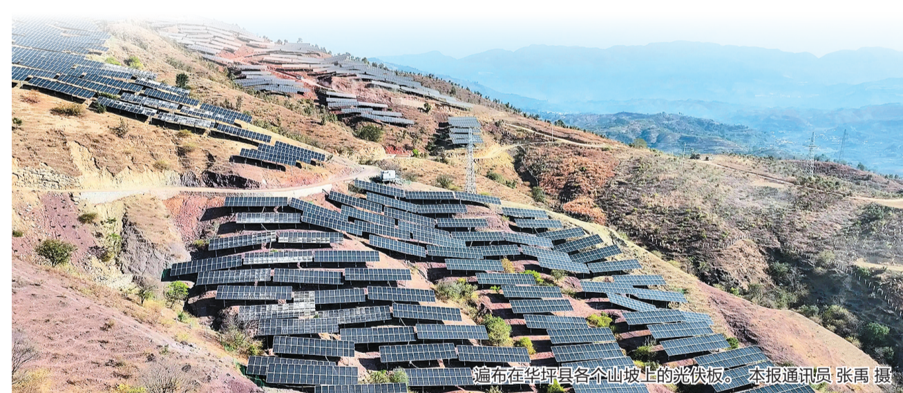
遍布在华坪县各个山坡上的光伏板。

在华坪县,华丽高速公路分布式光伏、公用停车场“光伏+充电桩”等创新项目加速落地,农光互补、村集体光伏