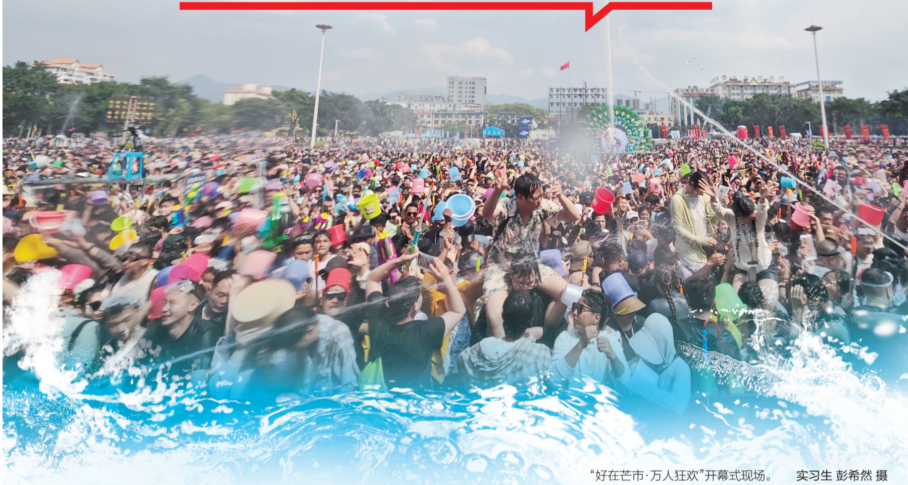
“好在芒市·万人狂欢”开幕式现场。

4月的德宏傣族景颇族自治州芒市街头水花飞扬、欢乐四溢。“村有喜事·同泼一江幸福水”主题人文交流活动在泼水节期间同步开展，来自缅甸、老挝、文莱的嘉宾参加“好在芒市·万人狂欢”开幕式活动，品尝民族团结街宴，走进冬瓜村等地，在泼水互动、同餐共叙和民俗体验中，感受德宏浓郁的节日氛围与边疆民族文化魅力。